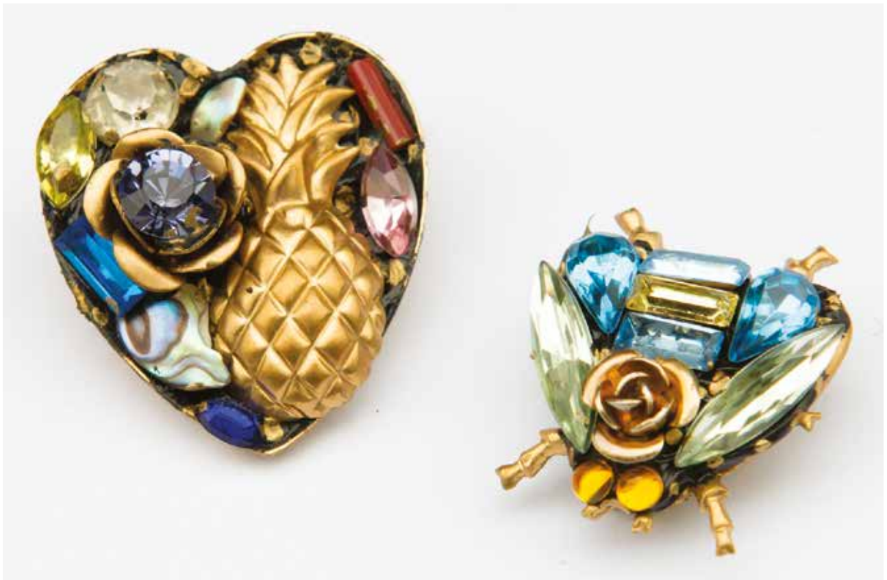
Annie Sherburne Sparkling Jewellery